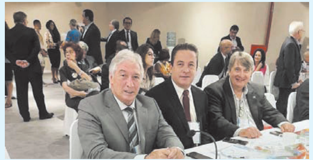
67ª reunião do Conselho Nacional dos Dirigentes de Regimes Próprios de Previdência Social - CONAPREV, nos dias 28 e 29 de novembro, em Recife/PE