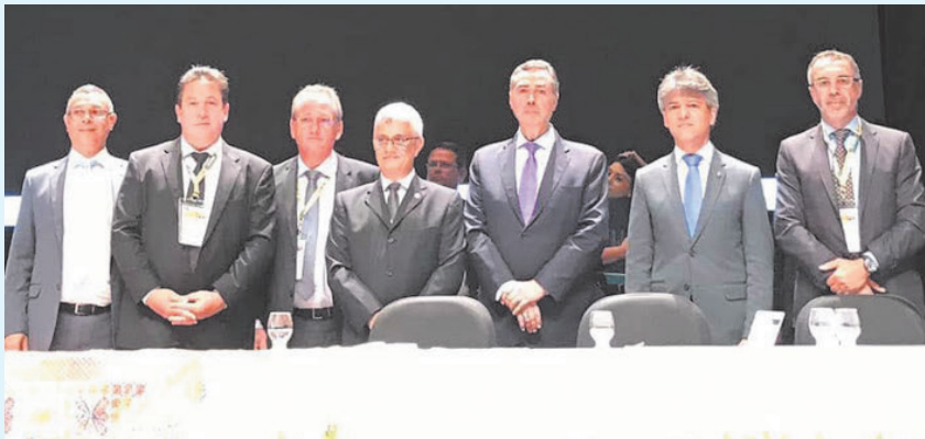
18º Congresso Previdenciário ANEPREM de 18 a 20/11/2019.