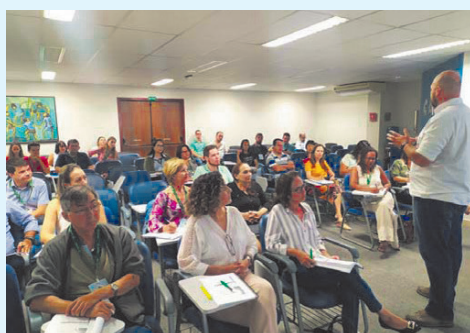
O Curso de Compensação Previdenciária em Maringá teve participação expressiva e interativa de todos os inscitos, realizado nos dias 12 e 13/03/2020