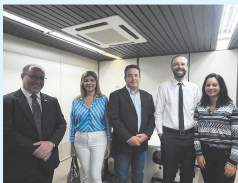
Visita ao Tribunal de Contas na manhã do dia 11/12/19 para obter informações sobre o entendimento do TCE em relação a EC 103/2019.