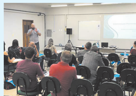
Curso de Compensação Previdenciária - COMPREV em Toledo - PR, 10 e 11/02/2020