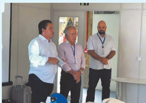
Curso prático de Compensação Previdenciária na sede do Paraná Previdência, em Curitiba em maio/2019.